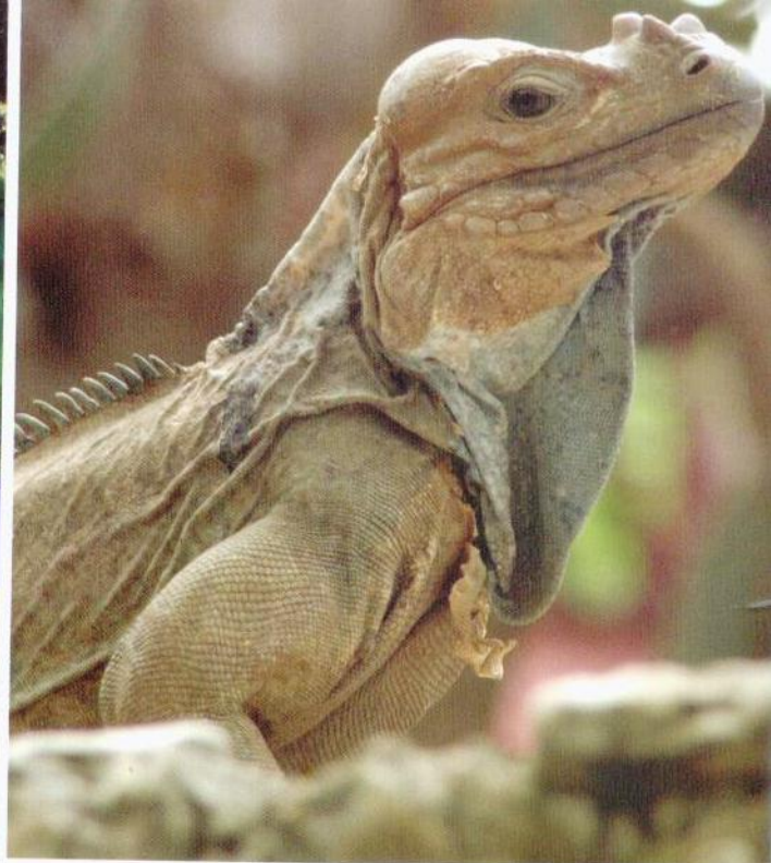
Iguana Rinoceronte.